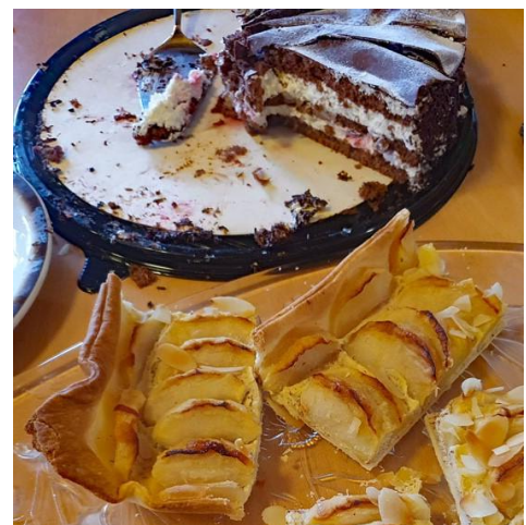
Senioren-Advent in Fürstenuan