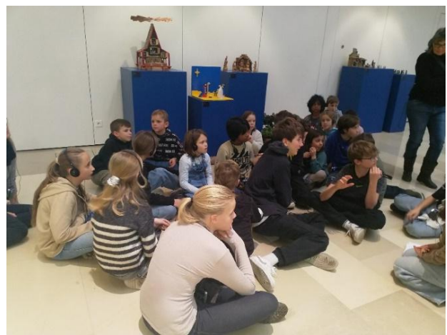
Ausflug der Schüler und Schülerinnen der Schule Fürstenuan an die Adventsausstellung in Chur